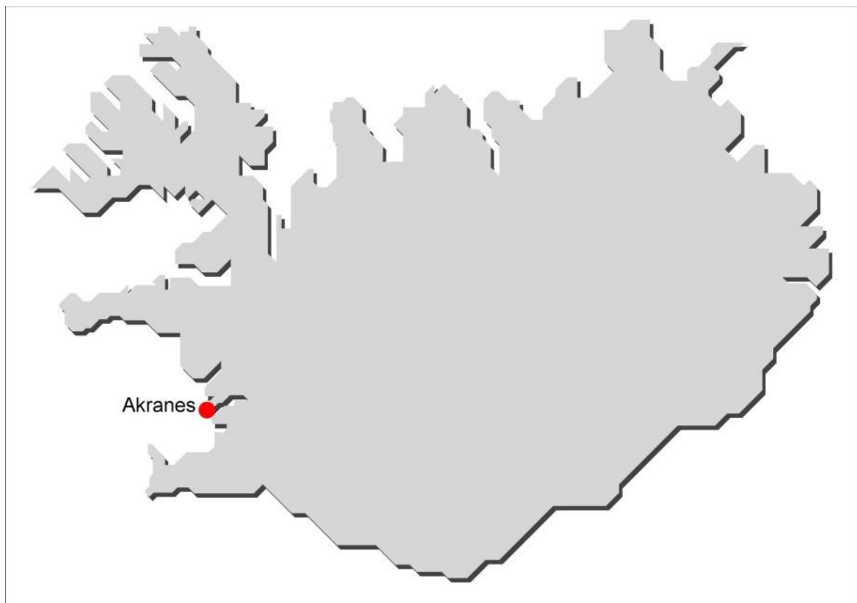
Mynd 1. Akranes