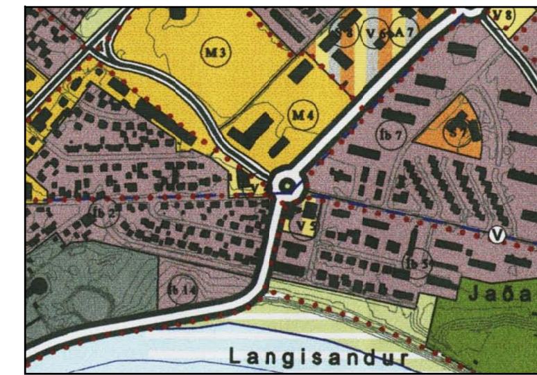
HLUTI AF AÐALSKIPULAGI AKRANESS 2005-2017

Að öðru leyti gilda fyrri almennir skilmálar.