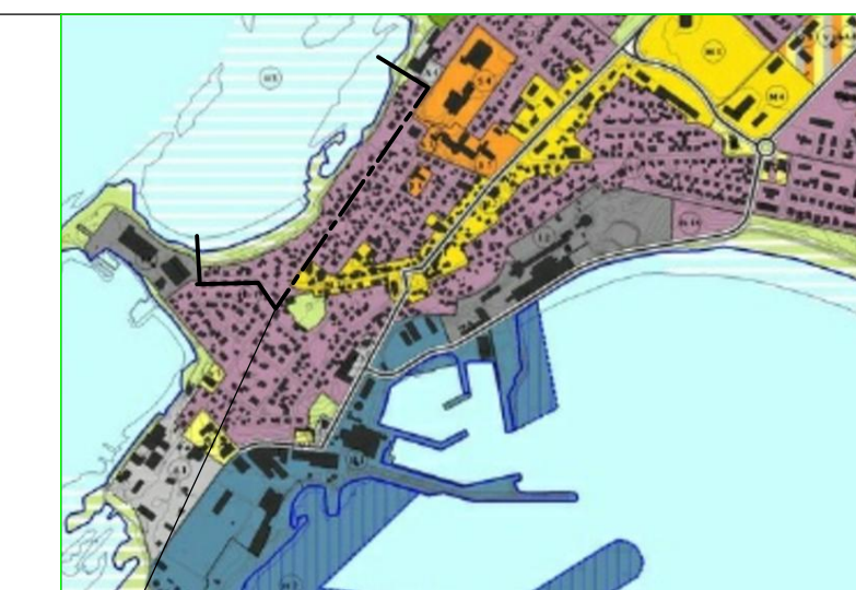
HLUTI ÚR ADALSKIPULAGI AKRANES