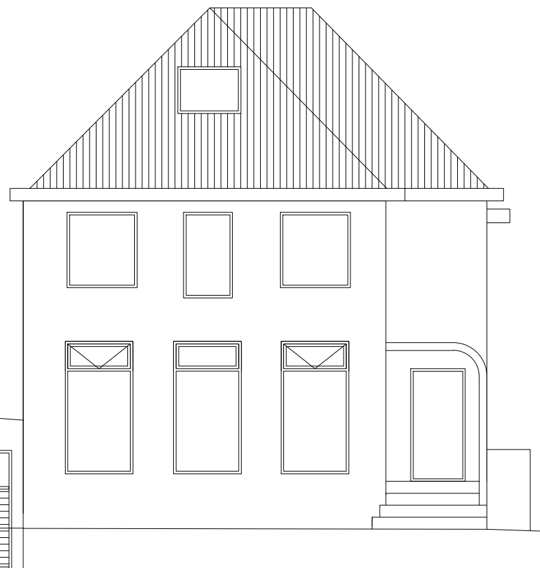
Breytt útlit 1:100

Fyrirspurn til byggingafulltrúa / Umsókn um byggingarleyfi.