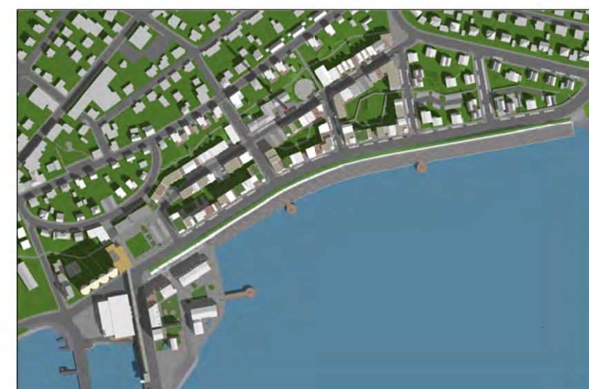
Skuggavarp 21. mars kl. 10