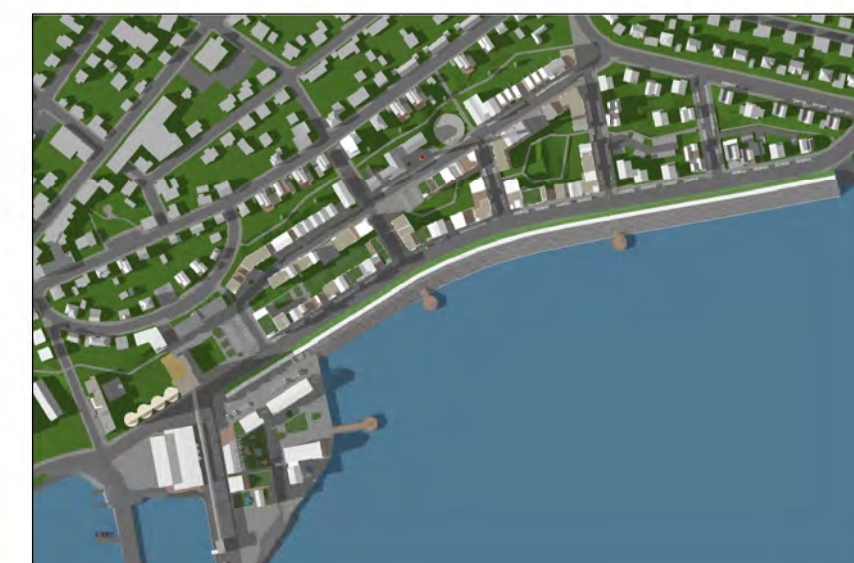
Skuggavarp 21. mars kl. 17