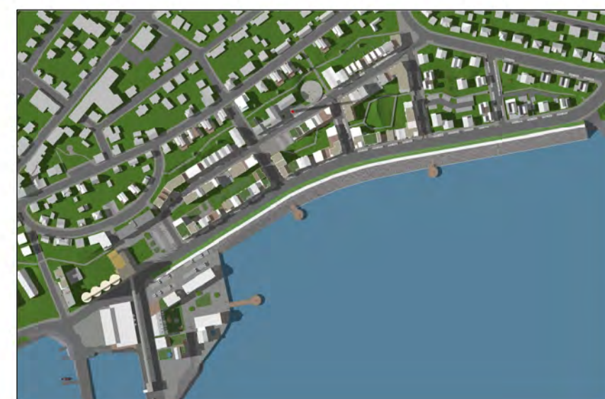
Skuggavarp 21. júní kl. 17