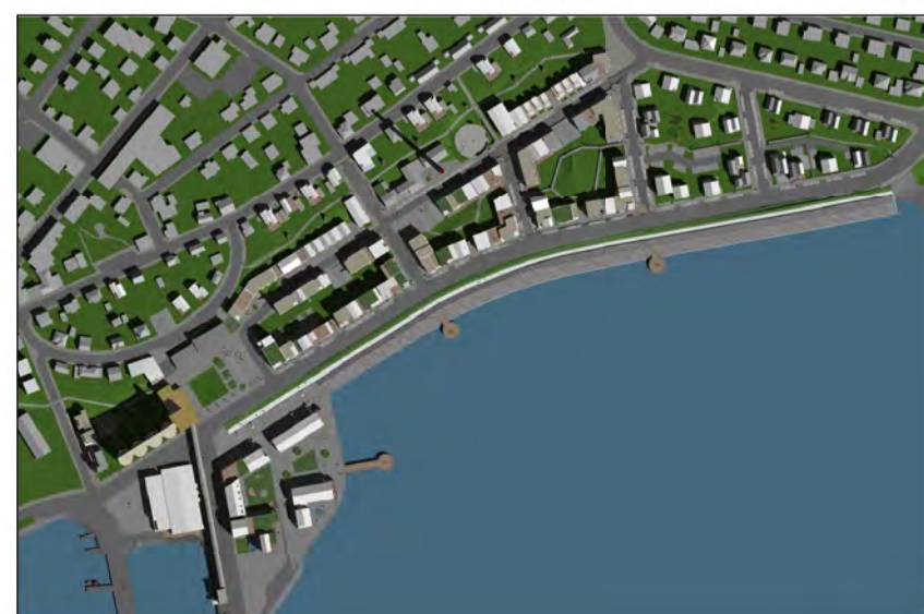
Skuggavarp 21. júní kl. 10