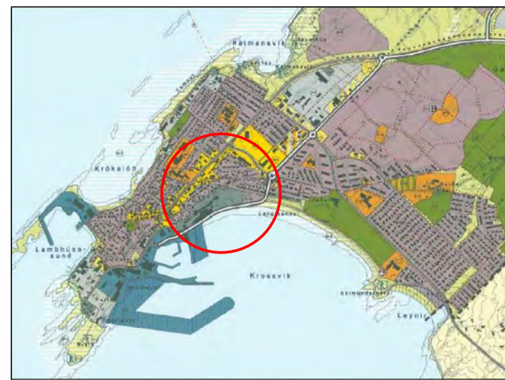
ADALSKIPLAG AKRANESS 2005-2017