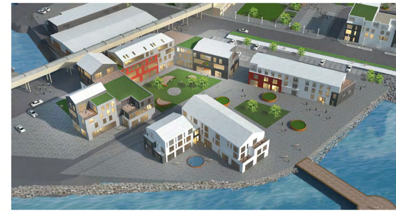
Reitur I - J