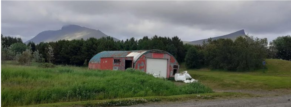
Mynd 5. Braggi í Túnásum, við skógræktina á Akranesi.

Áður nefndir staðir eru allir á þurrlendinu við Garða og klapparholtin, en ekki er kunnugt um neinar minjar í flóanum, sem kemur ekki á óvart. Miklir flóar eru nær allt í kringum Akrafjall og þær fáu fornleifar sem fundist hafa á þeim slóðum eru undantekningalaust þar sem byggilegast var, þ.e. á eða við klapparholt og önnur berghöft sem rísa upp úr mýrunum. Er því ólíklegt að finnist fornleifar í Garðaflóa. Hinum megin við skipulagsreitinn, þ.e. að norðvestanverðu, þar sem Akrafjallsvegur og Þjóðbraut koma saman, voru miklar mógrafir (050) en liggja utan með mörkum skipulagssvæðisins. Þjóðbraut liggur þar sem áður var gömul þjóðleið (049), kölluð „Nýi vegurinn“ á uppdrætti frá 1901 6 .