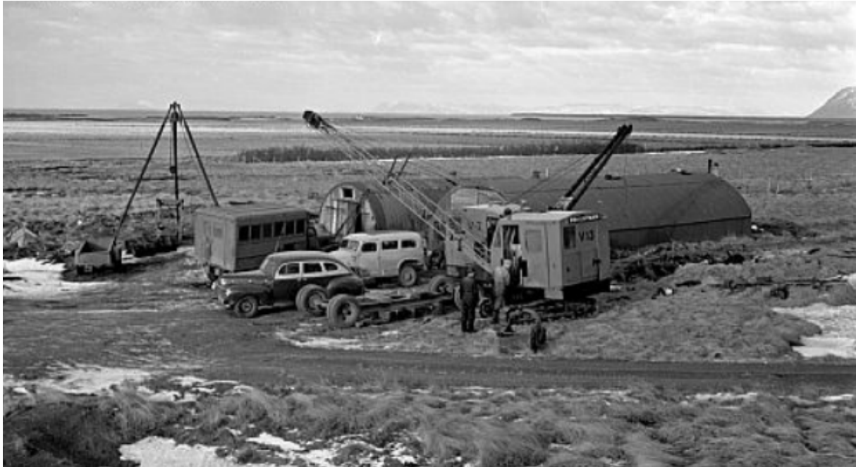
Mynd 6. Braggar hjá Görðum, þar sem síðar var verkstæði Vélasjóðs.

skipulagsreitinn, þar sem nú er golfvöllurinn. Hin almenna regla um friðhelgi fornleifa miðar við 100 ár, en Minjastofnun er heimilt að friða yngri minjar sem taldar eru hafa sögulegt gildi.