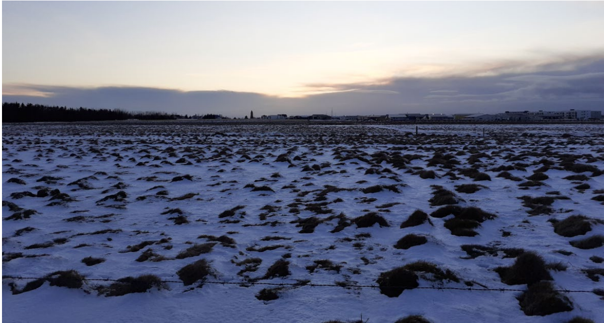
Mynd 3. Garðaflói. Í forgrunni er nyrsti hluti skipulagsreits upp við Akrafjallsveg, minnismarkið um Garðakirkju ber við himinn í suðri.