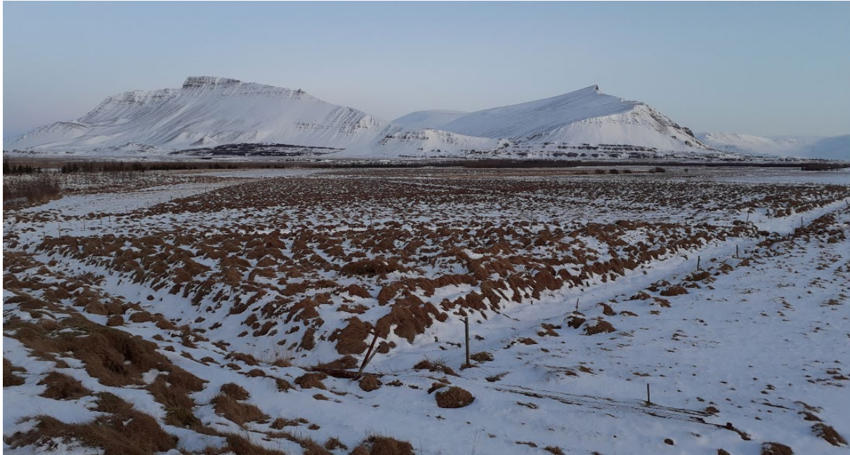
Mynd 2. Myndin er tekin á Stóra-Einbúa, holti vestarlega í flóanum, og horft er til austurs yfir skipulagssvæðið.