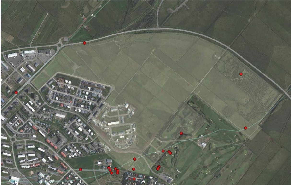
Mynd 4. Skipulagsreitur í Garðaflóa. Rauðu punktarnir sýna dreifingu staðanna sem fjallað er um í skýrslunni. Bláu línurnar sýna legu þjóðleiða niður á Skaga.

Garðafloí var farartálmi, enda landið blautt og illt yfirferðar. Þjóðleiðin (049) lá annarsvegar um fjöru og klapparholt vestan við skipulagsreit, u.þ.b. þar sem nú er þjóðvegurinn, en einnig lá vel fær leið (056) um hlað í Görðum suðvestan úr Jaðri, og til norðausturs að rótum Akrafjalls. Lá leiðin þar sem þurrast var innan um klapparholtin milli Garða og fjallsins og er lega hennar m.a. sýnd á mjög gömlum uppdrætti af Akranesi (frá 1802) 4 . Nær hún skáhall yfir suðausturhorn skipulagsreits þar sem nú er golfvöllur og skógrækt, og með klapparholtunum við norðvesturhorn reitsins, með stefnu á Garðasel og Berjadalsá norðan reits.