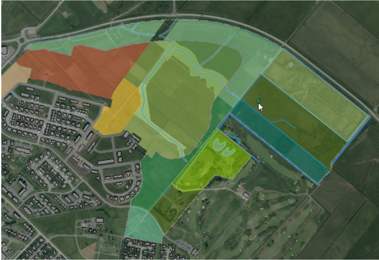
Mynd 1. Uppdrátturinn sýnir deiliskipulagsmörk sunnan Akranesvegur-Akrafjallsvegur (© Árni Ólafsson/Teiknistofa Arkitekta Gylfi & Co; © Loftmyndir ehf)