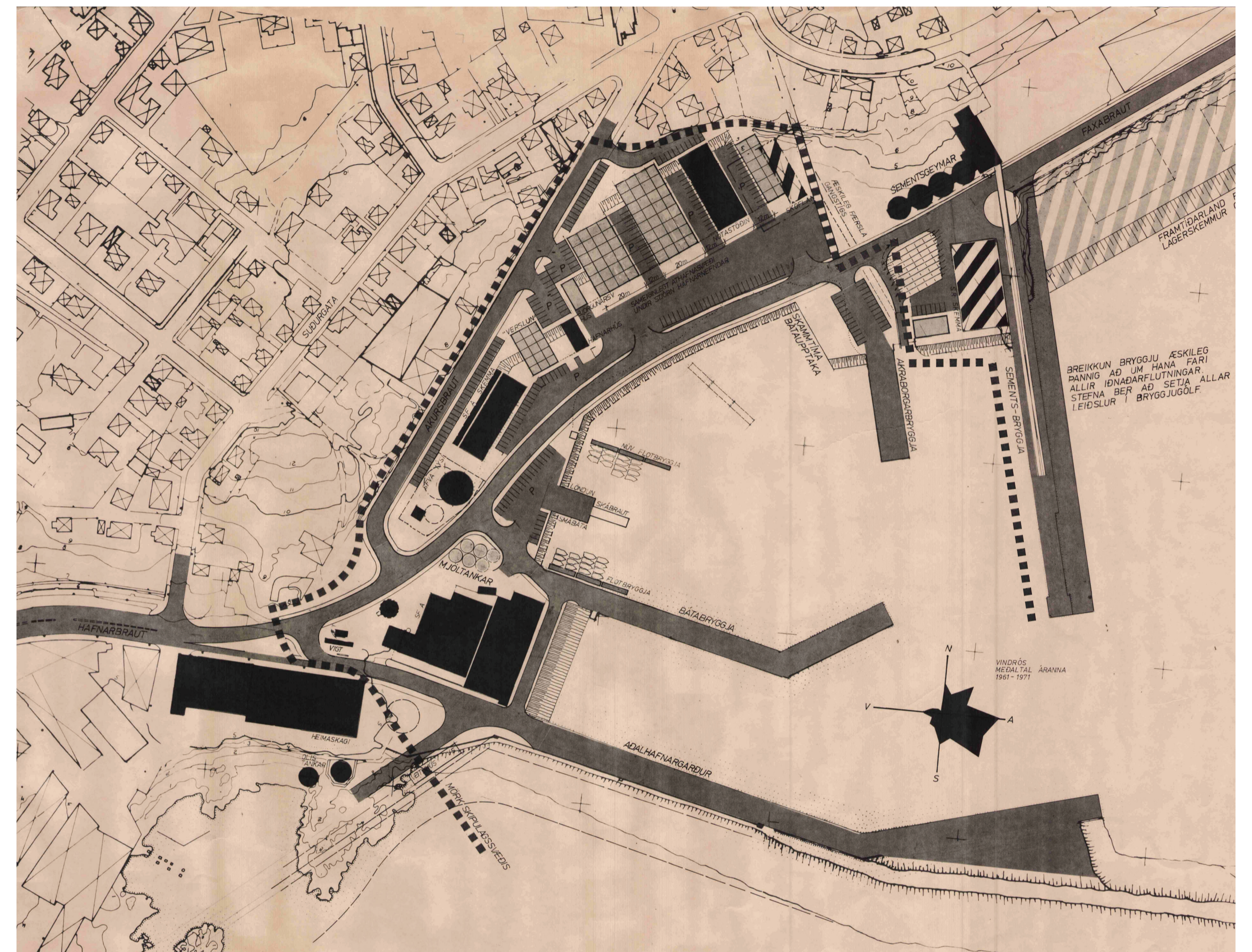
Akraneshöfn. Tillaga að breyttu deiliskipulagi.