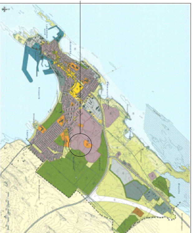
YFIRLITSMYND AF AKRANESI