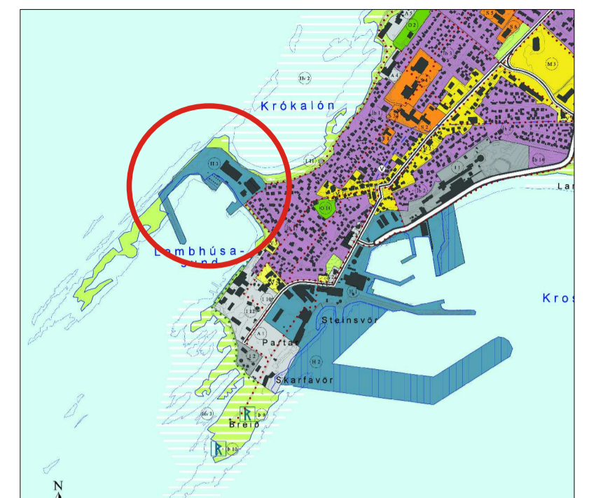
Hluti úr aðalskipulagi Akraness 2005-2017 (ekki í kvarða)