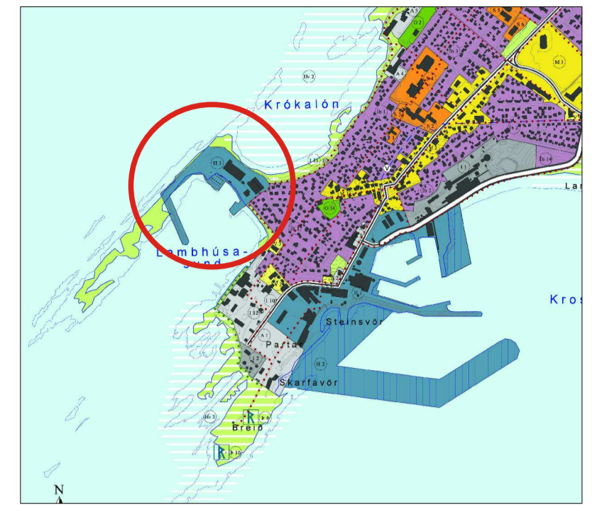
Hluti úr aðalskipulagi Akraness 2005-2017 (ekki í kvarða)