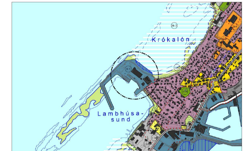
Aðalskipulagsbreyting, Staekkun hafnarvæðis H3. Staðfest í júní 2012. (ekki í kvarða)

GILDANDI DEILISKIPULAG Mkv. 1:1000 Samþykkt í bæjarstjórn Akraneskaupstaðar 22.01.2013 með síðari breytingum