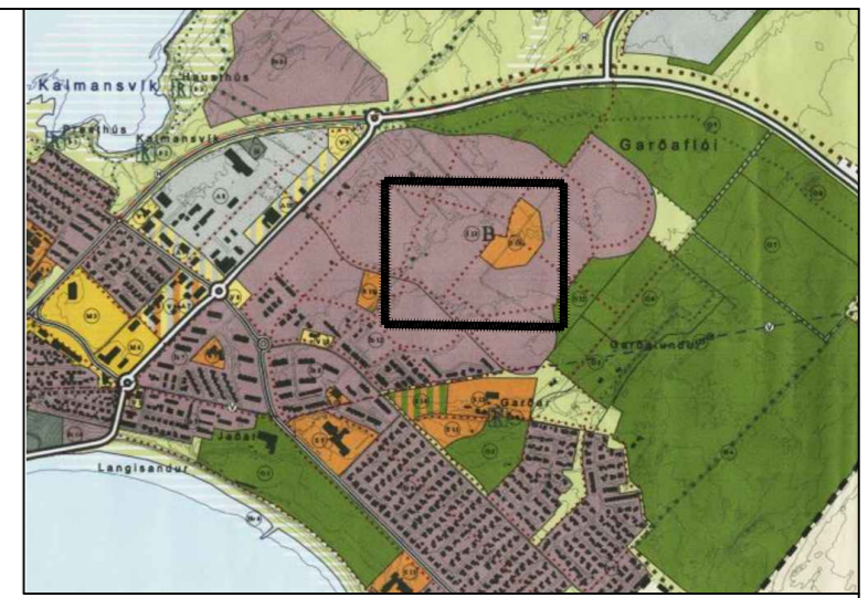
Hluti Aðalskipulags Akraness 2005-2017